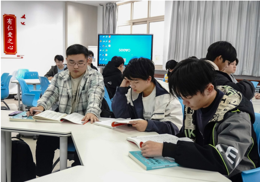
摄影 大通社记者 王娜琳

校园里斑驳的火车头，是学校旧时光与新故事的见证者，随着时间推移，它的铁皮外衣一次次被锈蚀，又一次次被涂上新装。车轮稳稳扎在基座上，烟囱直指天际，却不见丝毫动摇，像被定格的航标。回想起几个月前，我带着高考后的松弛感与它合影，尚不知这“没动”的火车头，会见证一场学风与成长的双向蜕变。 “小林，你站在火车头前面，我给