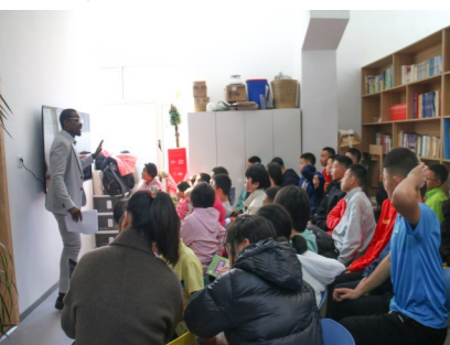
“向日葵”志愿服务队走进“梦想之家”

每年，校外辅导员郭明义都会来到校园，如与青年学子重读习近平总书记给“郭明义爱心团队”回信内容，或是走上文化讲坛分享过往经历，或是带着师生踏着泥泞，追寻矿山路上的“雷锋身影”。