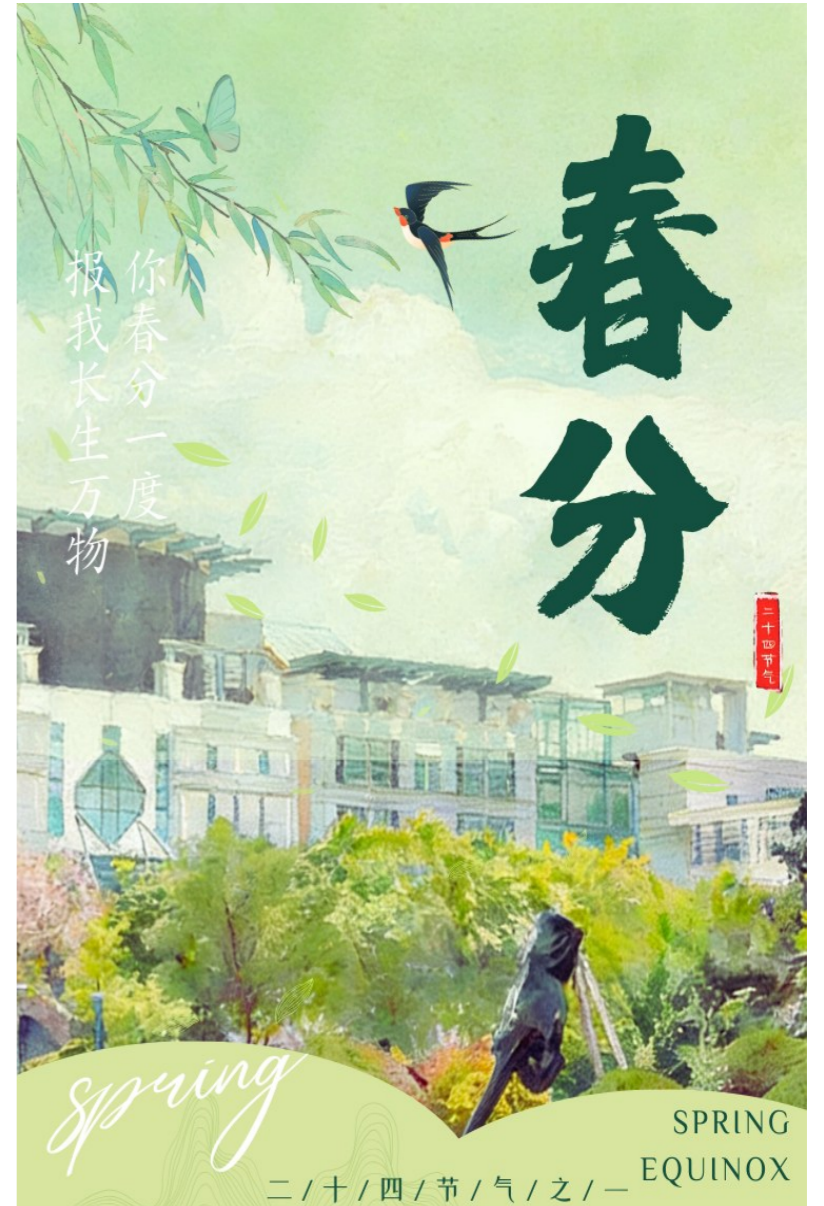
▲风拂柳丝，燕啄新泥，春分携着满纸绿意，落在我们的校园里，愿我们不负时光，不负生长，借春风之势，在成长的路上步履不停，让每一份热爱都向阳生长。