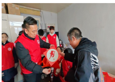
学校组织开展“大手拉小手，跟着郭明义重走矿山路”，以及非遗传情公益行动等多样化的学雷锋活动。

鞍钢英模文化是我国工业文明与红色文化的重要组成部分，这一文化资源既承载着工业报国的家国情怀，又蕴含着精益求精的工匠精神，与高校思政课“立德树人”的根本教学任务高度契合。在“大思政”格局下，将鞍钢英模文化融入高校思政课教学，为思政课注入工业文明的鲜活素材的同时，还可以通过英模事迹的感染力引导学生树立正确的价值观。