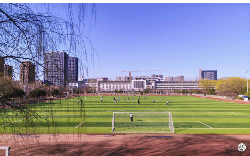
▲绿茵场上，春风拂过树梢，也拂过少年们意气风发的身影。