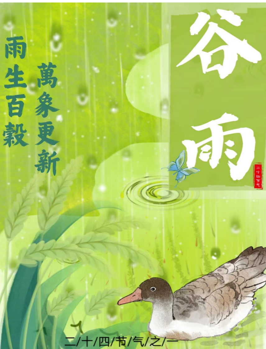
海报设计 卓无机 2025.2 孙睿谦